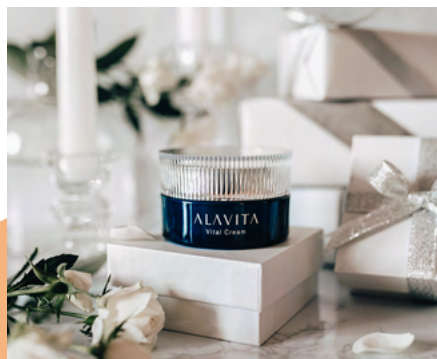
アラヴィータ ヴァイタルクリーム

真冬にこそ愛用したいこっくり濃密なクリーム。温めながらなじませる「スタンプ塗り」がポイント。フランキンセンス* 3 やユーカリ* 4 の精油で、優しい高揚感も楽しんで。