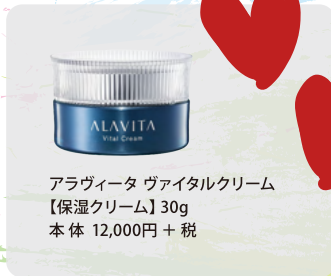
アラヴィータ ヴァイタルクリーム 【保湿クリーム】30g 本体 12,000円 + 税

ALAVITA商品開発担当。幼いころから母の化粧品(スキンケア、香水、メイクなど)を使用して、自分につけて遊ぶのが大好きでした。化粧品の開発関連の仕事は10年以上携わってきました。お肌のケアはもちろん日々のスキンケア、そしてストレスをため込まないように発散しています。海外大好き。